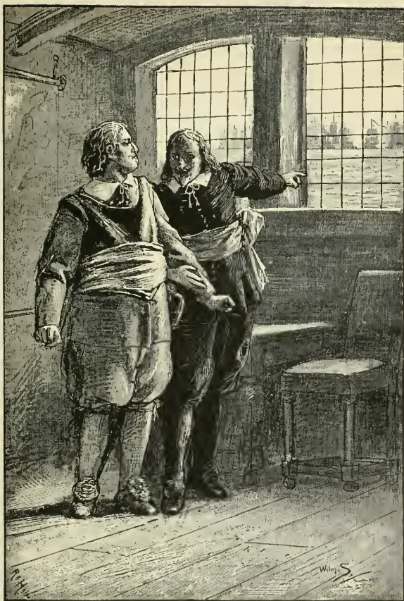
Pag. 118 zie zelf, de Spanjaarden zijn tienmaal sterker dan wij.